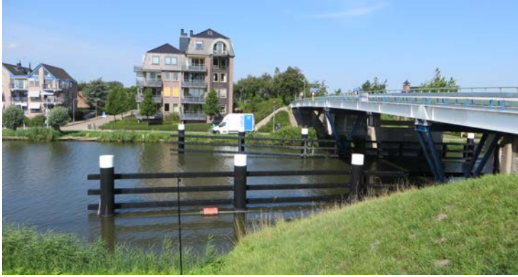
Voorbeeld van een provinciale weg met een stalen brug te midden van een waterrijk dorp