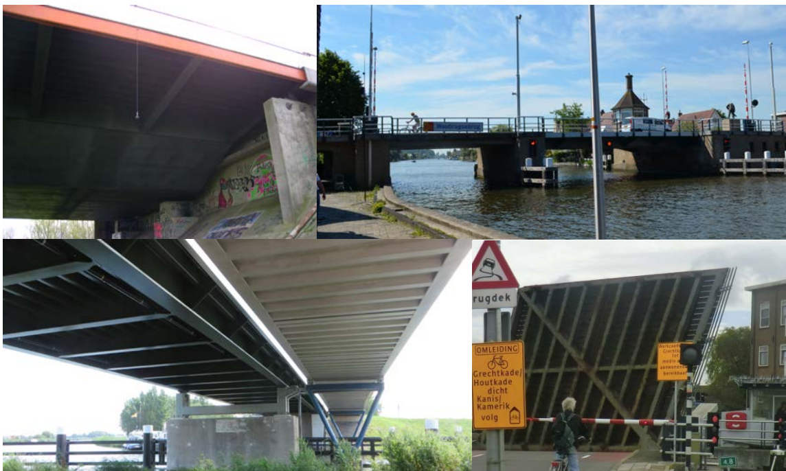
Voorbeelden van stalen bruggen in verschillende afmetingen en verschijningsvormen waarvan de geluidemissie werd onderzocht

Er is dan ook geen generieke oplossing voor het aanpakken van geluidhinder van stalen bruggen. Voor iedere brug moeten maatwerkoplossingen worden gezocht.